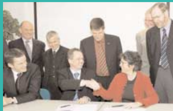
Achterste rij: raadsleden van de gemeente Hoogezand-Sappemeer